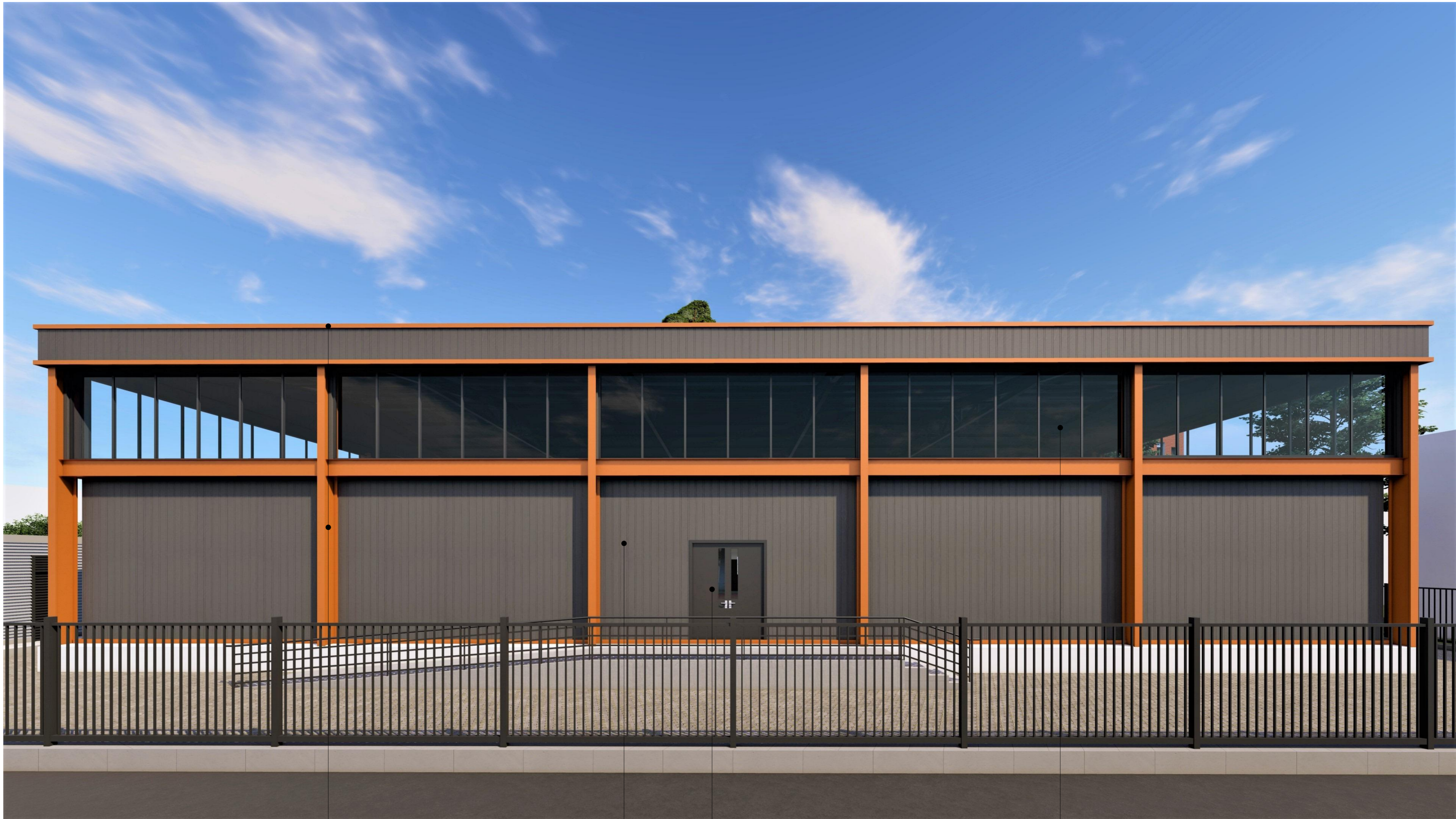
დარბაზის საფასადე კონსტრუქციული ნაწილი შეღებლი ანტიკოროზიული საღებავით (RAL 2003)