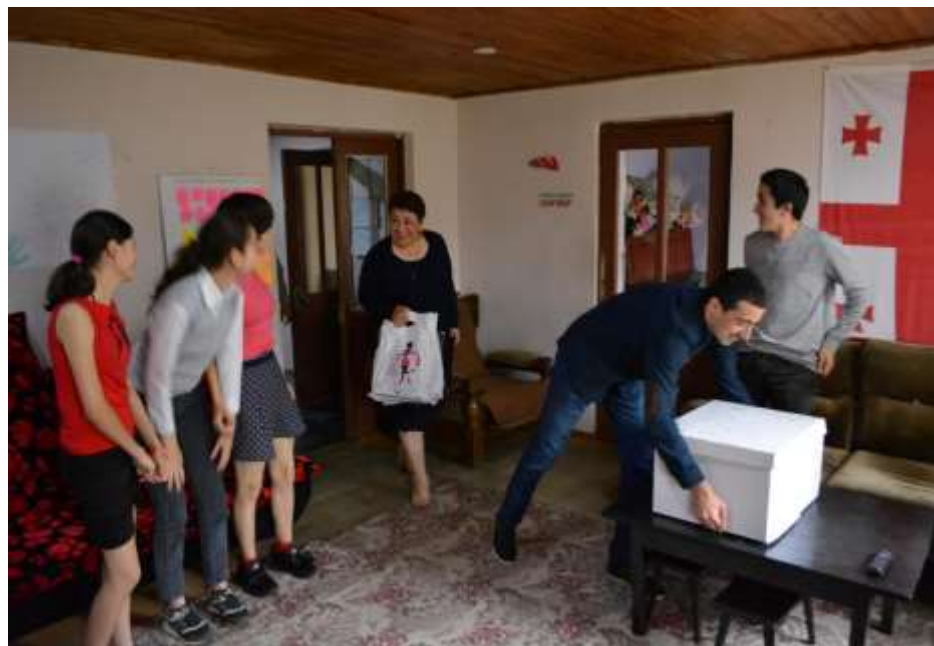
ბავშვთა დღე მცირე საოჯახო ტიპის სახლში

ფრაქციის წევრები საკუთარი სახსრებით ჩართული არიან სხვადასხვა სახალხო თუ კოპულარულ აღსანიშნავ ღონისძიებაში.