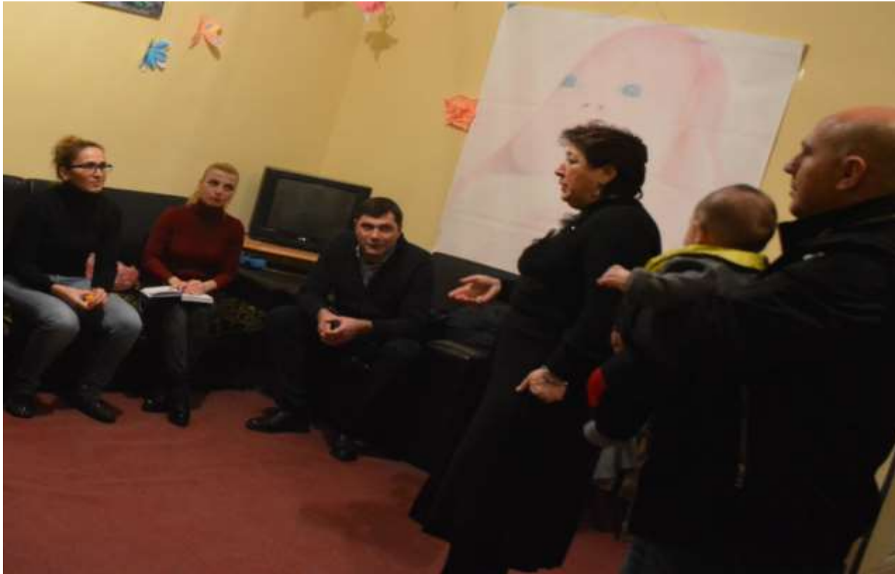
სტუმრად მარტოხელა დედებთან თავშესაფარში

ასეთი ვიზიტების დროს იკვეთება კონკრეტული პრობლემები, რომელთა მოგვარებაზეც შემდგომში ფრაქცია ზრუნავს. მაგალითად, მარტოხელა მშობლებთან ვიზიტის შემდეგ ცვლილება იქნა შეტანილი ქვეპროგრამაში „მუნიციპალური ტრანსპორტით მგზავრობის საფასურის სუბსიდირება“. კერძოდ, მარტოხელა მშობლებსაც გაეწევათ სუბსიდირება.