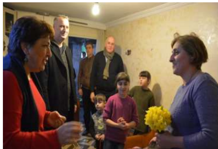
დედის დღე მრავალშვილიან დედასთან